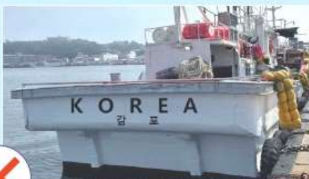
선명 표시 잘못된 예 (영문 표기 X)