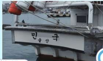
어선명칭 정상 기재