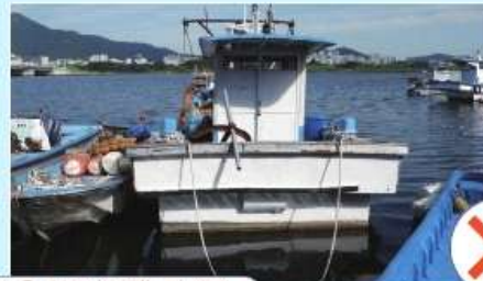
선미부(선명, 선적항), 선측 양현(선명) 미기재