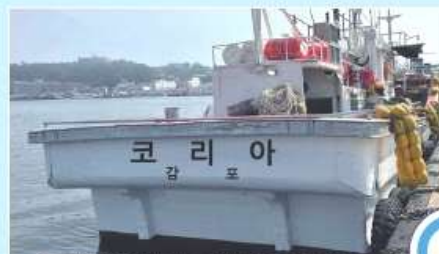
선명 표시 잘된 예 (한글 표기 O)